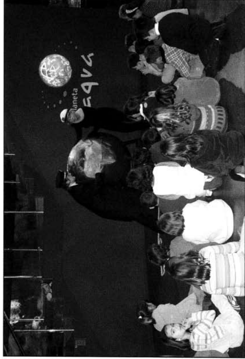
billedtekst = Medspilsteater i akvariet i Barcelona