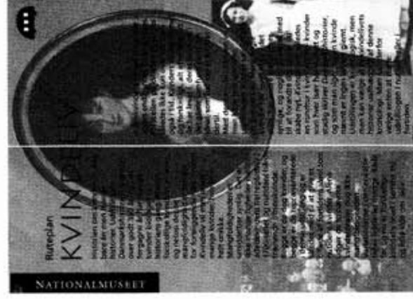
Folder til ruten

Dermed ikke sagt, at ruteplanerne i sin nuværende form ikke fremstår som et godt og brugbart redskab. Hjemme fra kan museums-gæster nu via Nationalmuseets hjemmeside klikke sig ind på den af de tre ruter, der er det foreløbige resultat af vores eksamensprojekt. Med et print i hånden får gæsterne på Danmarks Historier 1660-2000 nu mulighed for at låne nogle "særlige briller". Disse er indtil videre: Kvindeliv, Fællesskaber og Magten.