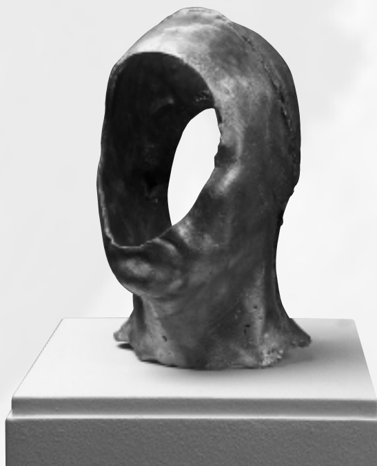
Christian Lemmerz: Selvportræt. 1992. (Aluminium h.31,5 cm)