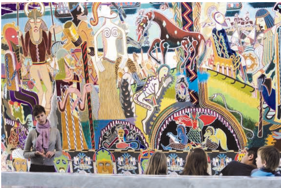
Rundvisning på KØS.