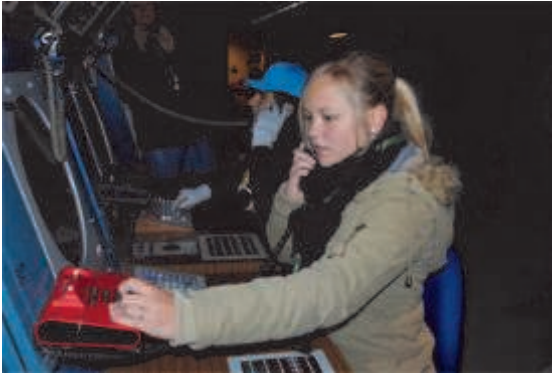
Elever i gang med et udskolingsundervisningsforløb på Koldkrigsmuseum Stevnsfort.

kende til at fremme et engagement i samfundet – og måske baner vejen for en ny protestsang som Nenas 99 Luftballons.