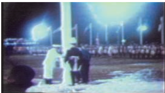
First independence ceremony, November 30th, 1966

It was the birth of an Independent Barbados. For the next 29 years the celebration of independence would be a mere military parade on the Garrison savannah on the morning of the anniversary, November the 30th. Later in the evening, the Prime Minister would host a reception for invited guests at his official residence, Ilaro court. For the first 28 years this was the Barbadian official celebration of independence.