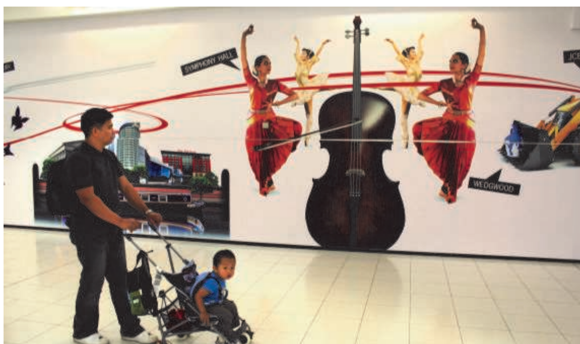
Birmingham lufthavn.

Det var der i alt tre ud af de 60 institutioner, som syntes var en god idé, og som skrev under. De andre 57 havde af forskellige grunde ikke lyst til at forpligte sig på noget - i hvert tilfælde ikke så længe CKI stod som afsender. Var charteret kommet fra Kulturministeriet, havde det sandsynligvis fået en mere varm modtagelse. Og dog. Vær ikke for sikker. For helt grundlæggende er de kræfter, som CKI's charter sætter sig op imod, at Danmark er det land, der blandt 24 lande scorer højst, når det handler om at anse monokultur som ønskværdigt.