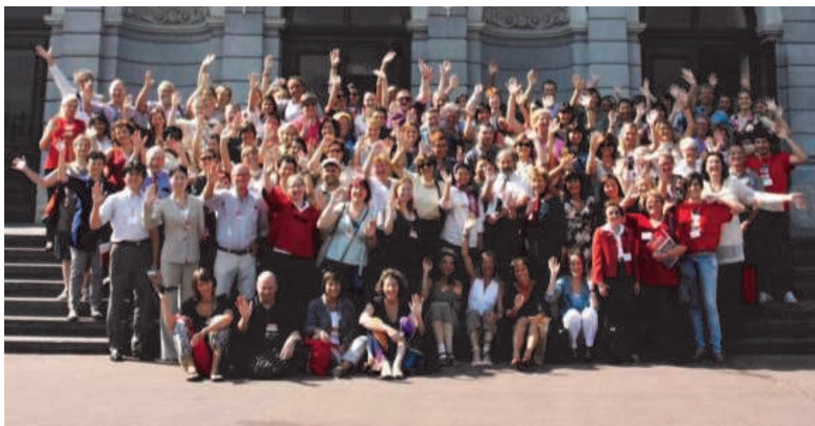
Deltagerne, CECA-konference 2011, Zagreb

OBS. Danske CECA-medlemmer, der ikke modtager information fra CECA, må meget gerne sende deres mail til mg@tekniskmuseum.dk , da al korrespondance forgår via mail.