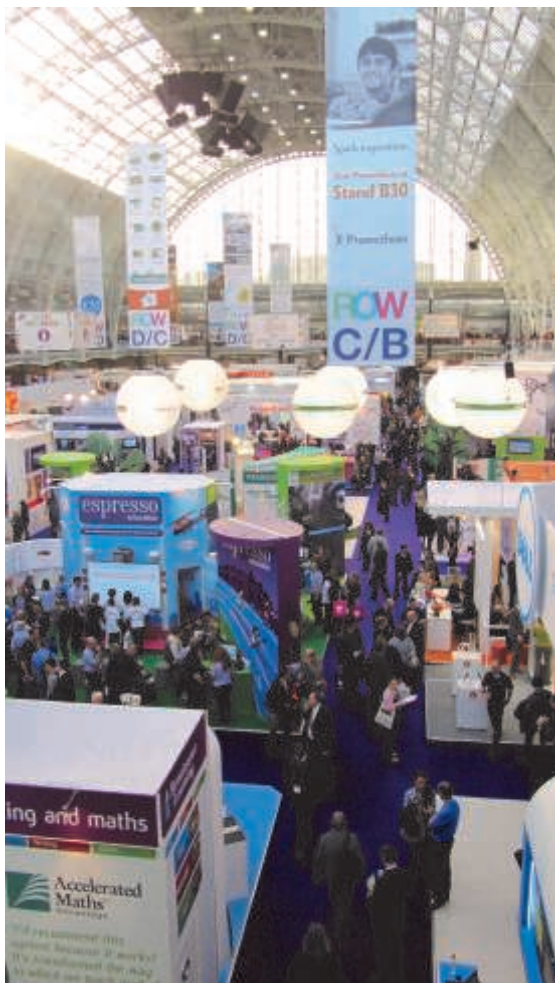
Olympia, London, BETT messen. Foto Anders Stubkjær.