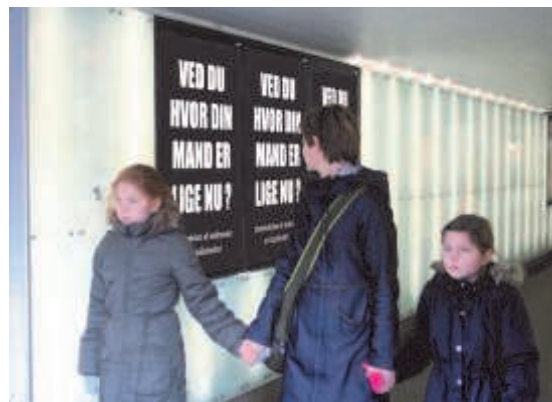
En del af oplysningskampagnen fra Engelsborgskolen var rettet mod sekskunder. En af kampagnens plakater stillede spørgsmålet: "Ved du, hvor din mand er lige nu?"

Da elevernes kampagnemateriale var færdigt, blev det præsenteret i klasserne for derefter at blive udstillet på Arbejdermuseet. Åbningen af udstillingen