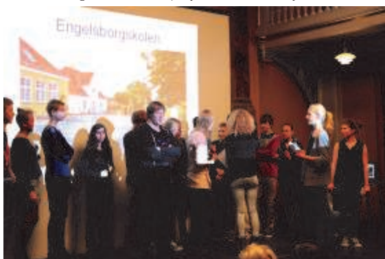
8.a. fra Engelsborgskolen præsenterer deres kampagne for de andre deltagende klasser i projektet.

Kunstværkerne i den resterende del af udstillingen demonstrerede, hvordan kunst kan have en stemme i den politiske og samfundsmæssige debat. Efter de tre workshop og yderligere et undervisningsforløb om oplysningskampagners grundelementer på skolen, var eleverne klædt på til at udarbejde deres egen oplysningskampagne.