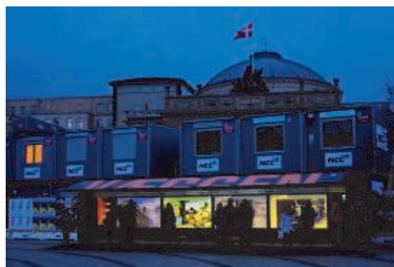
VÆGGEN at dusk. Foto: jed 2009. Fra VÆGGEN

Baggrunden for projektet er de arkæologiske udgravninger, der finder sted i forbindelse med anlæggelsen af en ny metro linje i København. Opgaven har givet en enestående mulighed for at undersøge, dokumentere og fortolke byens historie. Med VÆGGEN har museet forsøgt at skabe en platform, hvor også byens borgere deltager i arbejdet med at definere og formidle kulturarven.