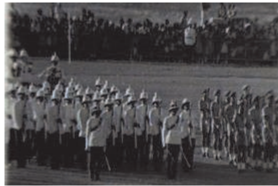
Independence celebration, Garrison savannah, Nov, 30, 1976

It was the birth of an Independent Barbados. For the next 29 years the celebration of independence would be a mere military parade on the Garrison savannah on the morning of the anniversary, November the 30th. Later in the evening, the Prime Minister would host a reception for invited guests at his official residence, Ilaro court. For the first 28 years this was the Barbadian official celebration of independence.