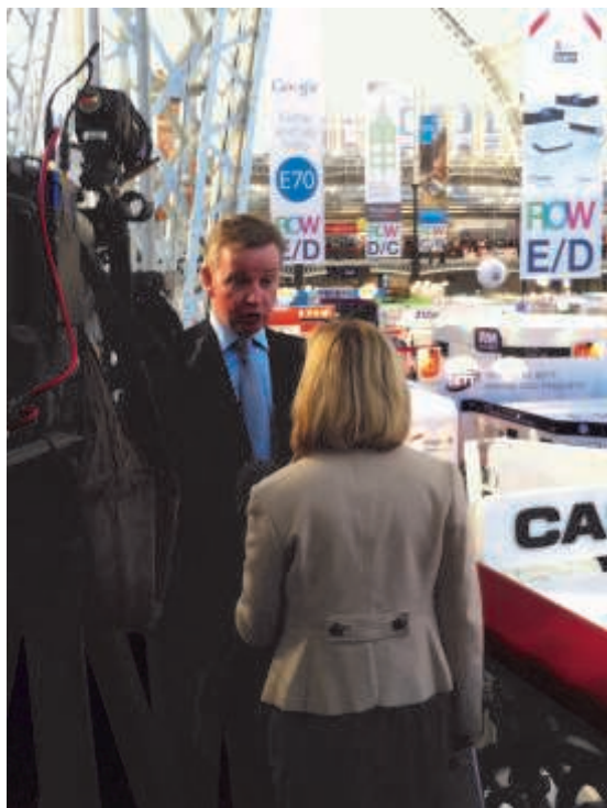
Olympia i London, hvor BETT messen fandt sted.