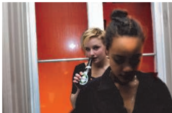
Dare me? Foto: Nomis 2010. Fra VÆGGEN.

Men hvad skal museumsinspektøren bidrage med her? Skal jeg perspektivere og nuancere debatten med min særlige viden om graffiti i historien? Vil min professionelle indblanding ikke automatisk få en særlig autoritet, der kan være med til at lukke diskussionen? Eller skal jeg træde ind i debatten med subjektive holdninger - og demonstrere, at museernes arbejde med kulturarven udføres af enkelte individer, der kan påvirke det? Vil dette ikke underminere min egen professionelle persona? At gå i dialog med brugerne skaber dilemmaer, der rækker helt ind i den enkelte medarbejder.