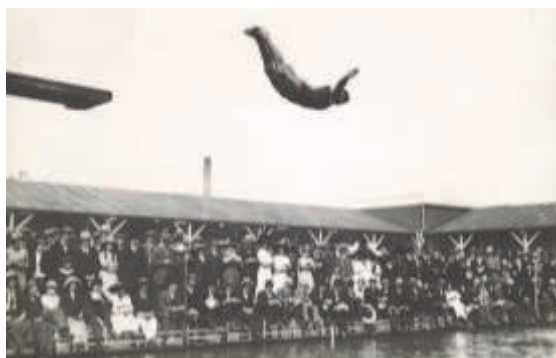
Opvisning i udspring på badeanstalten Helgoland ca. 1910.