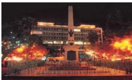
Official lighting ceremony in Bridgetown

The official launch of the Community Independence celebration is held on the last Saturday in August. At this even event the parish ambassadors are formally introduced to the public, and the programme of national activity for independence is revealed. As the month of independence dawns, there is an official lighting ceremony in the island, where the capital city of Bridgetown and governments building in other towns, and all roundabouts are beautifully lit. This programme which is a joint effort between the public and private sector uses the national colours and symbols and stimulates nationalism. The ceremony officially signals the start of the month of celebrations and it has become one of the major highlights of national life at independence time.