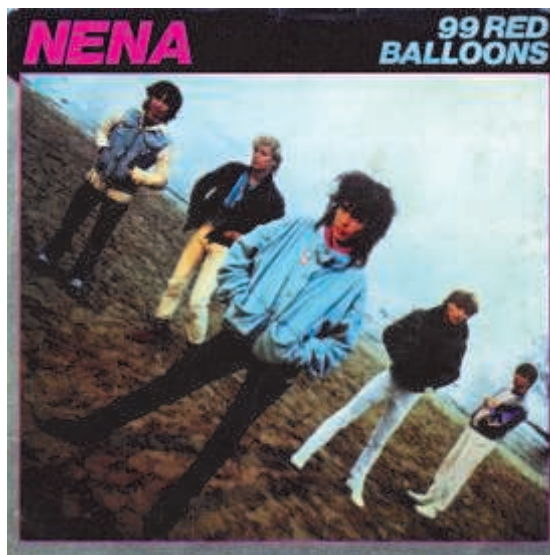
Cover fra det tyske pop-rock band Nenas single 99 Luftballons fra 1983

Erindringen om Den Kolde Krig og sounden af det tyske pop-rock band Nenas protestsang fra starten af 80'erne dukker op hos alle over 30, hvorimod den historiske periode i udskolingselevens øjne er gamle dage - fjern og til dels uvedkommende. Udfordringen i undervisningen af denne målgruppe - der populært sagt er 'lukket for ombygning' - er at gøre historien nærværende og relevant ved at involvere eleverne i undervisningens aktualisering og perspektivering af den historiske periode. Når nøglen ind til elevernes opmærksomhed og nysgerrighed er fundet, melder spørgsmålet sig om forløbets læringsmål - fagfaglige såvel som almen-dannende. Et spørgsmål, der i det aktuelle eksempel rækker ind i Koldkrigsmuseums Stevnforts formidlingsvisioner, Østsjællands Museums samlede formidlingsstrategier og generelt forestillingen om museumsinstitutionens samfundsmæssige rolle. Når formidlingen er undervisningsrettet, stiller det endvidere krav til museumsinstitutionen om at forholde sig til uddannelsessektorens dannelsesidealer, som knytter an til en forestilling om medborgeren.