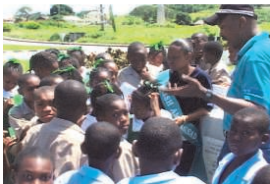
Pupils touring the monuments in the parish

The monuments visited included the Parry Monument, the birthplaces of two of the island's national heroes, The Right Excellent Charles Duncan O'Neal, and Right Excellent Errol Barrow. Additionally they toured the only octagonal chimney in Barbados, and the most recognisable monument in