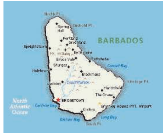
Map of Barbados

From time immemorial, heritage institutions such as archives, libraries and museums have been playing pivotal roles in bringing about societal and economic changes. The Great Library of Alexandria Egypt which functioned as a major centre of scholarship from its establishment in the 3rd century BC until the Roman conquest of Egypt in 30 BC stands as one of the earliest classic example of such heritage institutions. The library of Congress in Washington USA is a present day example. Throughout the centuries, policy-makers realised, and acknowledged that within these Heritage institutions there exists a wealth of political, social and economic activities that is fundamental for building the future. This paper presents the case of how a nation's preservation of its culture and heritage, and the use of that have brought about a high percentage of public discourse and community participation at all levels, resulting in a better informed citizenry. Using the "Community Independence Celebration" as the example, it will show how the democratization of heritage participation also encourages democratic public discourse. Furthermore it will detail how policies and projects designed to enhance community identity, sustainable cultures, and local economies can serve as tools for the wider cause of social development and positive social change.