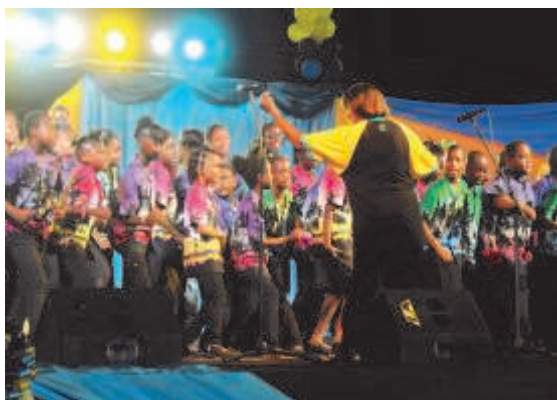
School children participating in independence celebration

pendence celebration in Barbados was made a more people- participatory activity touching the lives of every citizen in all communities across our nation. It ensured that independence became more than just a one day celebration, but a state of mind in every Barbadian throughout the year, and heightened during the entire month of November.