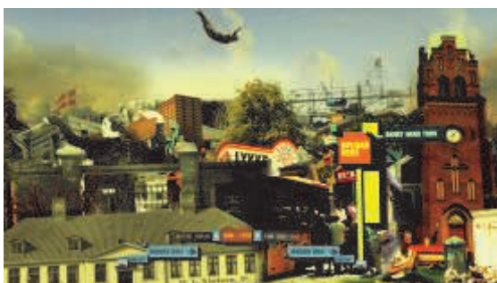
Udsnit af VÆGGENs København. Grafik: Spild af Tid 2009.

Tilbagemeldinger har bekræftet, at det anderledes univers drager brugerne ind. Men enkelte oplever også interaktionen med VÆGGEN som let frustrerende - fordi de er usikre på, hvilken adfærd der forventes af dem, og fordi de savner overblik og instruktion. Det fravær af autoritativ styring, der var centralt i VÆGGENs konceptuelle udvikling, resulterer for nogle i en forvirrende uendelighed af muligheder. For at imødegå dette arbejder museet pt. på tiltag, der skal inspirere brugerne uden direkte at instruere dem.