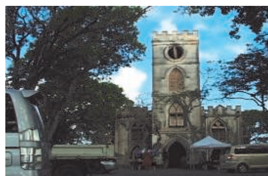
The historic Church of St John.

The example of the Parish Ambassadors of the parish of St Michael could also be cited. Barbados proposed two areas for inscription on the prestigious UNESCO World Heritage list, Greater Bridgetown and the Garrison and its historic area; these areas are found in the St Michael parish. The Ambassadors set out on a quest to sensitise Barbadians about the importance of this, what it meant to be inscribed, the benefits to Barbados, and Barbados' responsibilities when it is inscribed. To be effective, they consulted a number of historians,