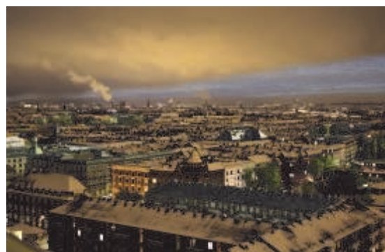
VinterNatSommerDag. Udsigt over København fra Domus Portus ved Nordhavn. Blanding af 2 ens billeder, taget en vinter nat og en sommer dag. Foto: Franks 2010. Fra VÆGGEN.

Brugerne bidrager med friske perspektiver, men der opstår også nye udfordringer: For hvad skal der ske med dette materiale, når formidlingsprojektet en dag er slut? Hvordan skal de nye erkendelser, der opstår, integreres i samlingerne? Hvem har ret til at analysere det ny materiale, og hvordan skal det ske uden, at de flerstemmige betydnings-