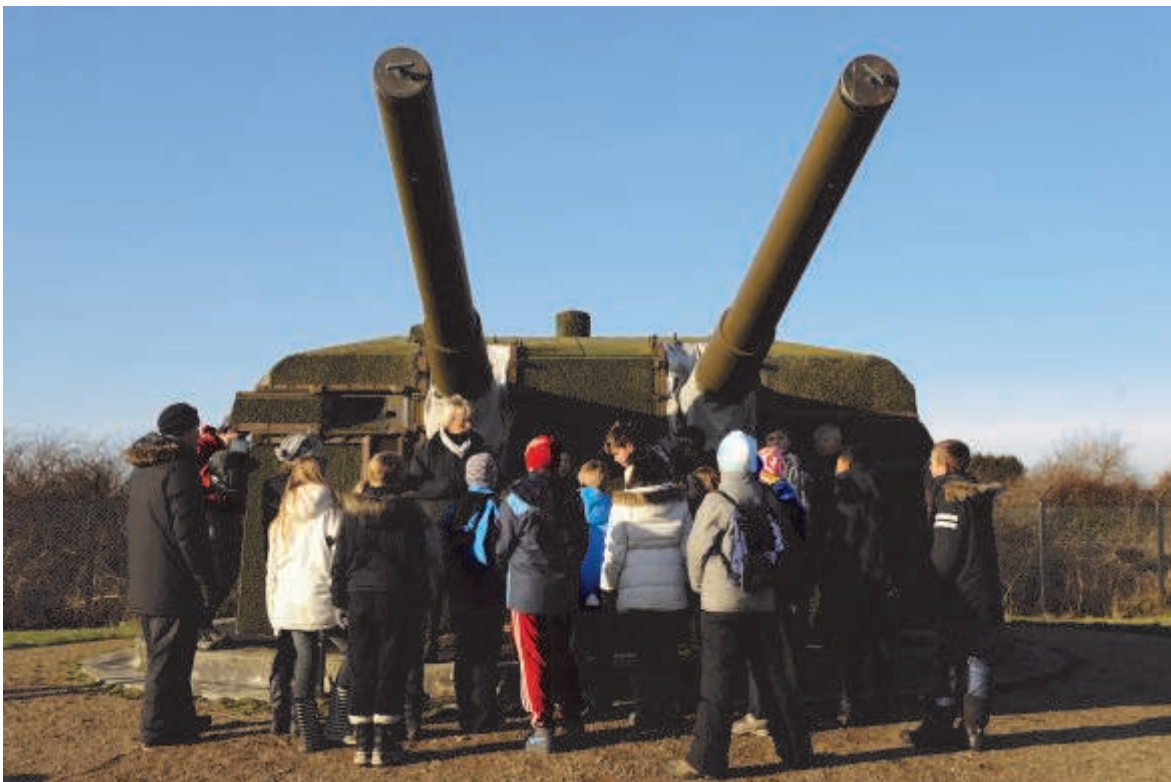
Undervisning på Koldkrigsmuseum Stevnsfort.